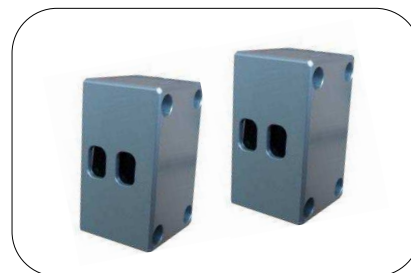
Horizontale sensoren buiten meting

• Solva Paasheuvelweg 26 1105 BJ Amsterdam-ZO The Netherlands