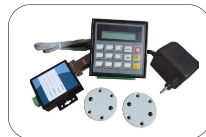
Standaard complete set